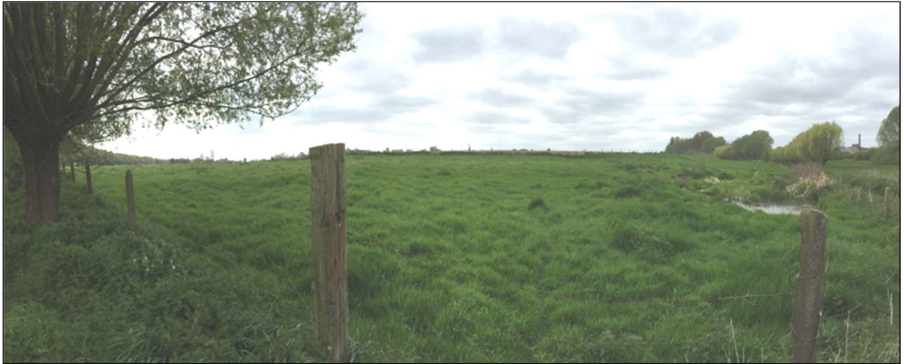
Foto plaatsbezoek april 2017

Op het Gewestplan is het perceel aangeduid als Natuurgebied: